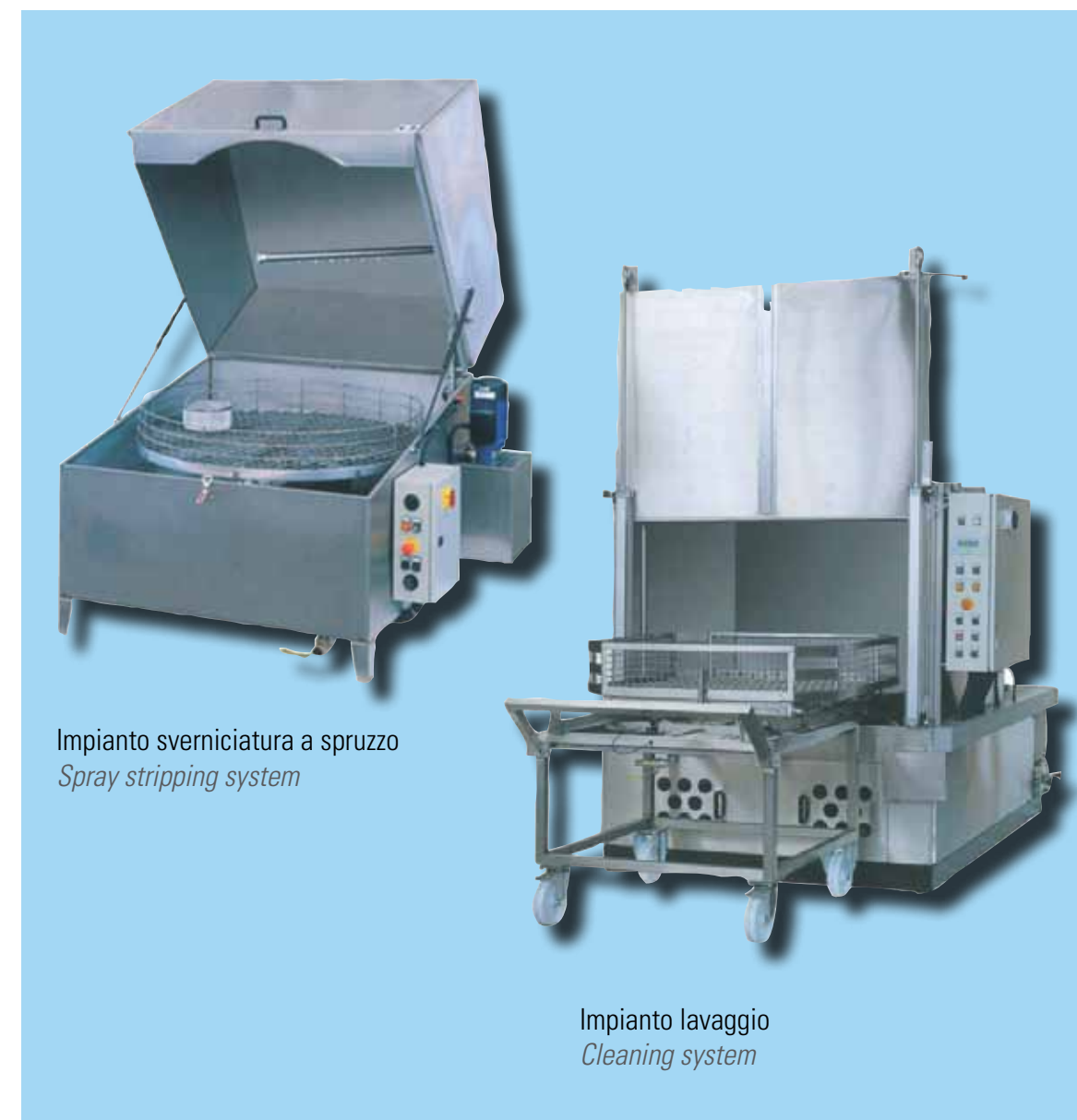
Impianto sverniciatura a spruzzo Spray stripping system